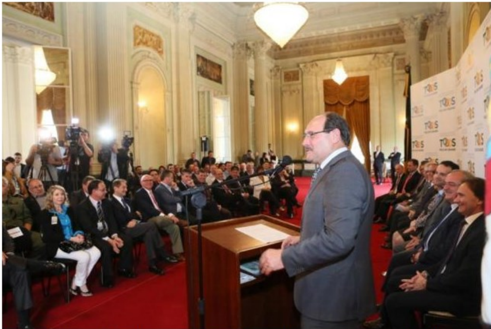
Com a presença do governador José Ivo Sartori, a Secretaria dos Transportes lançou, nesta segunda-feira, no Palácio Piratini, o Programa Estadual de Desenvolvimento da Aviação Regional (PDAR-RS)

Foi assinado na tarde desta segunda-feira, no Palácio Piratini, um termo entre o governo estadual e a Azul, empresa de linhas aéreas, para dar o pontapé inicial no Programa Estadual de Desenvolvimento da Aviação Regional, criado para ampliar rotas de voo pelo interior do Rio Grande do Sul.