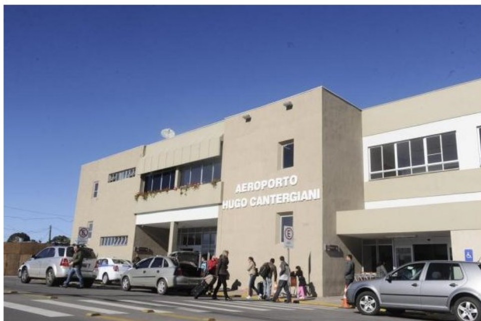
Aeroporto de Vila Oliva irá substituir o Hugo Cantergiani para atender a serra e até o sul de SC

O Ministro-Chefe da Secretaria de Aviação Civil da Presidência da República (SAC), Eliseu Padilha, afirmou nesta segunda-feira (1º) em entrevista à Rádio Gaúcha Serra que não há demanda de transporte de cargas para que os futuros aeroportos 20 de Setembro, em Portão, e Vila Oliva, em Caxias, operem juntos.