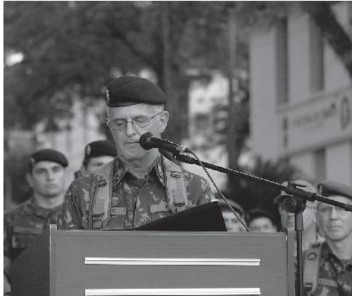
General Miotto se despediu ressaltando a importância da 3ª Divisão

As referências elogiosas concedidas ao oficial destacam suas ações frente a situações e projetos como o fortalecimento das atividades interagências e com os órgãos de segurança pública, a atuação na tragédia da boate Kiss, a aproximação com a comunidade e os desafios como a preparação do Batalhão de Infantaria de For-